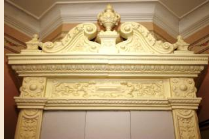
Ainoa jäljellä oleva kaakeliuuni.