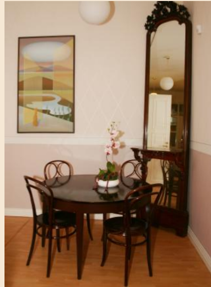
Keskikerroksen trymoo-peili (lattiasta kattoon ulottuva korkea kapeahko peili, jossa laskutaso keskkitienoilla).