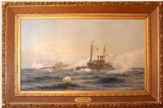
Herman af Sillénin Stridsskjutning-taulu juhlasalissa.