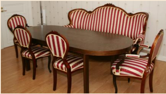
Rokokookalusto kaupunginjohtajan huoneessa.