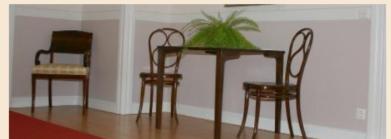
Kalustoryhmä toisen kerroksen aulassa.