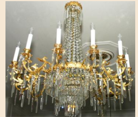
Juhlasalin kristallikruunut ovat 1800-luvun puolivälin tuotantoa.

Tullinhoitaja Brunow'n vuonna 1834 hankkima kaupunkitontti ulottui aikanaan Sovionlahteen