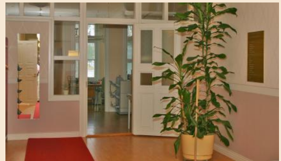
Viimeisimmässä peruskorjauksessa rakennettu erkkeri.